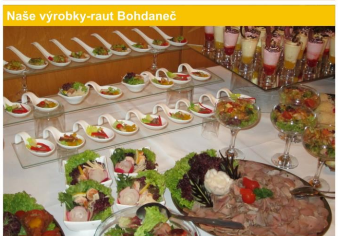
Naše výrobky-raut Bohdaneč