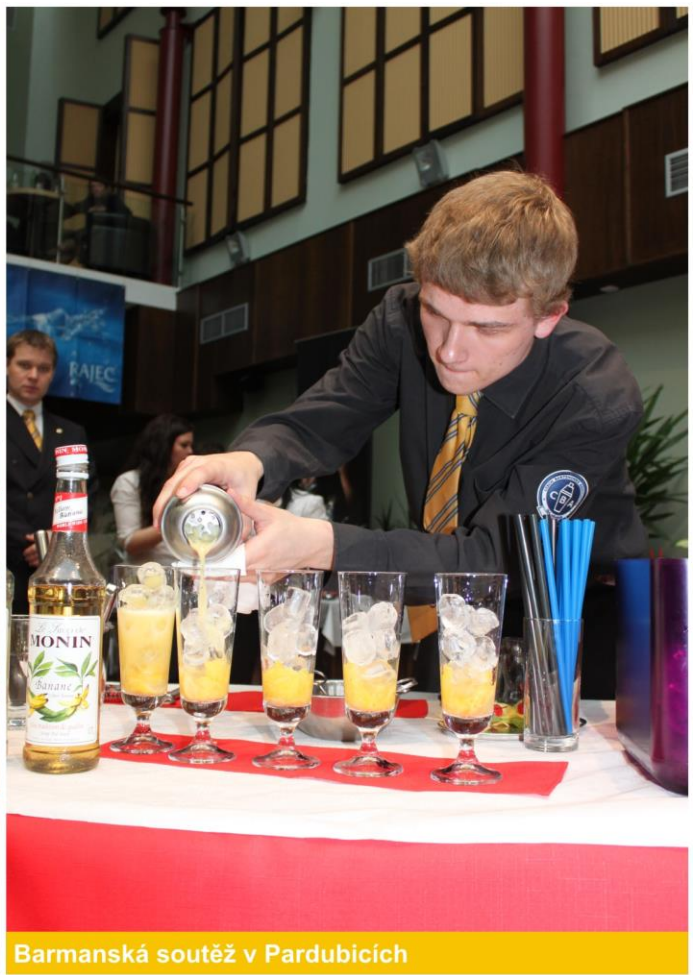
Barmanská soutěž v Pardubicích