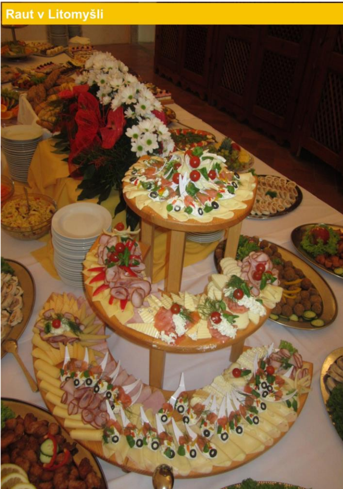
Raut v Litomyšli