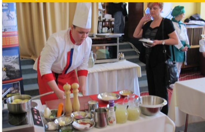
Tatranský kuchár Horní Smokovec 2013