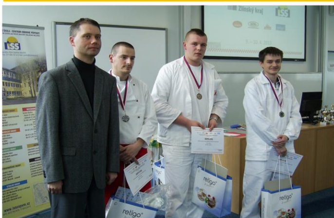
Přehlídka odborných dovedností oboru Řezník Valašské Meziříčí