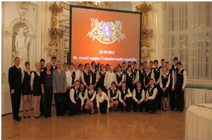
Obsluha na Pražském hradě