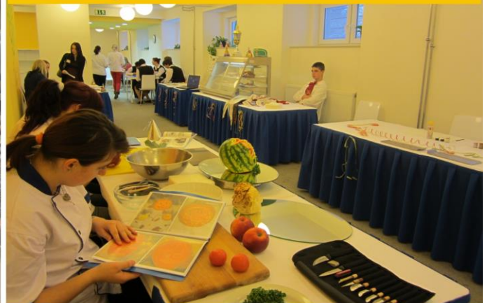
Den otevřených dveří na škole