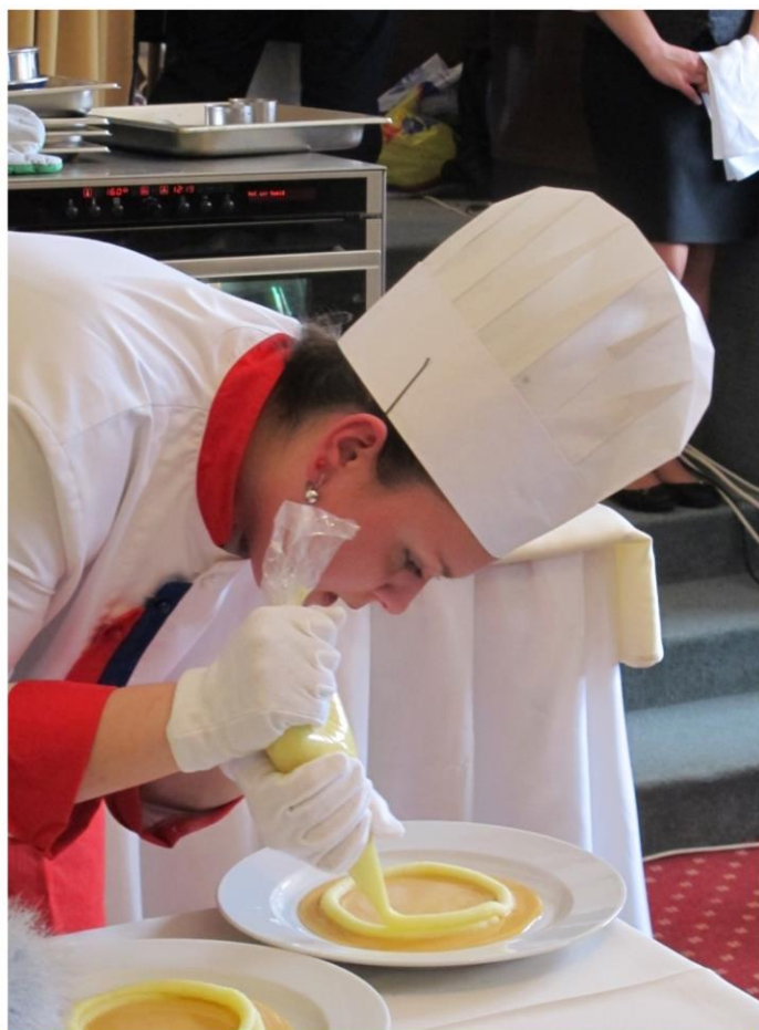
Gastro Junior Nowaco Cup 2013 Brno