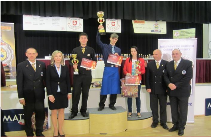
Labský pohár Pardubice