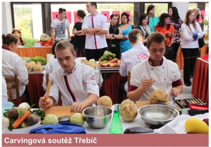
Carvingová soutěž Třebíč